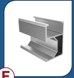
E PERFIS H2 2400 4 UNIDADES