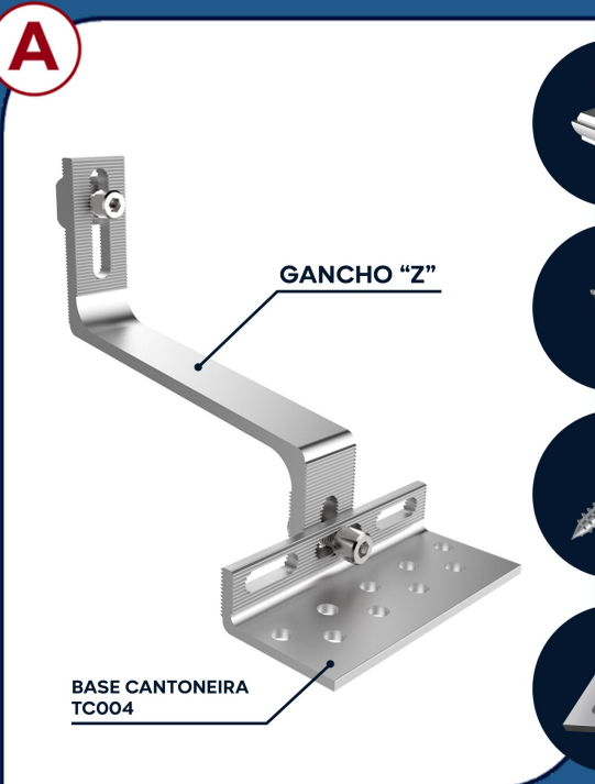
TC004 SUPORTE CERÂMICO 8 UNIDADES