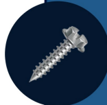
PARAFUSO ZINCADO 24 UNIDADES