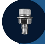
PC002 Parafuso M8+ Porca Sextavada 16 UNIDADES