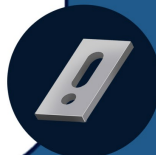
PR001 Prolongador em alumínio 8 UNIDADES