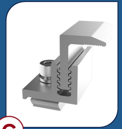
C TF001 Terminal Final 4 UNIDADES