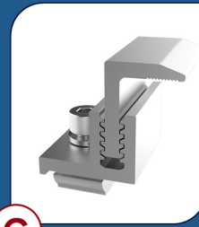
TF001 Terminal Final 4 UNIDADES