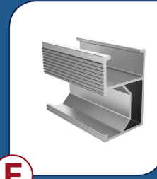
PERFIS H2 2400 4 UNIDADES