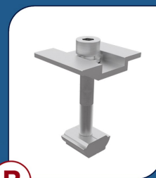
TI001 Terminal Intermediário 6 UNIDADES