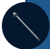
PF 110 Parafuso Autobrocante 110mm 8 UNIDADES