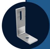
SUP L Suporte L Alumínio 8 UNIDADES