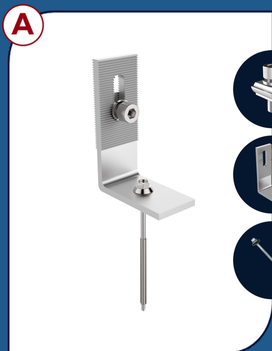
TM001 SUPORTE L SIMPLES - METÁLICO 8 UNIDADES