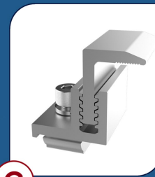
C TF001 Terminal Final 4 UNIDADES