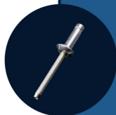
REBITE ESTRUTURAL 32 UNIDADES

*PARA INSTALAÇÃO DOS MÓDULOS NA POSIÇÃO RETRATO É NECESSÁRIO A ADIÇÃO DO ACESSÓRIO REG001 - IMPORTANTE INFORMAR O LAYOUT DE INSTALAÇÃO NO