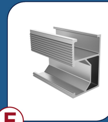
E PERFIS H2 2400 4 UNIDADES