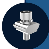
PC001 Parafuso M8 + Porca Alumínio 8 UNIDADES