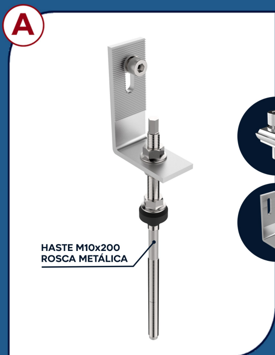
FM001 SUPORTE FIBROCIMENTO METÁLICO 200mm 8 UNIDADES