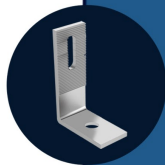
SUP L Suporte L Alumínio 8 UNIDADES